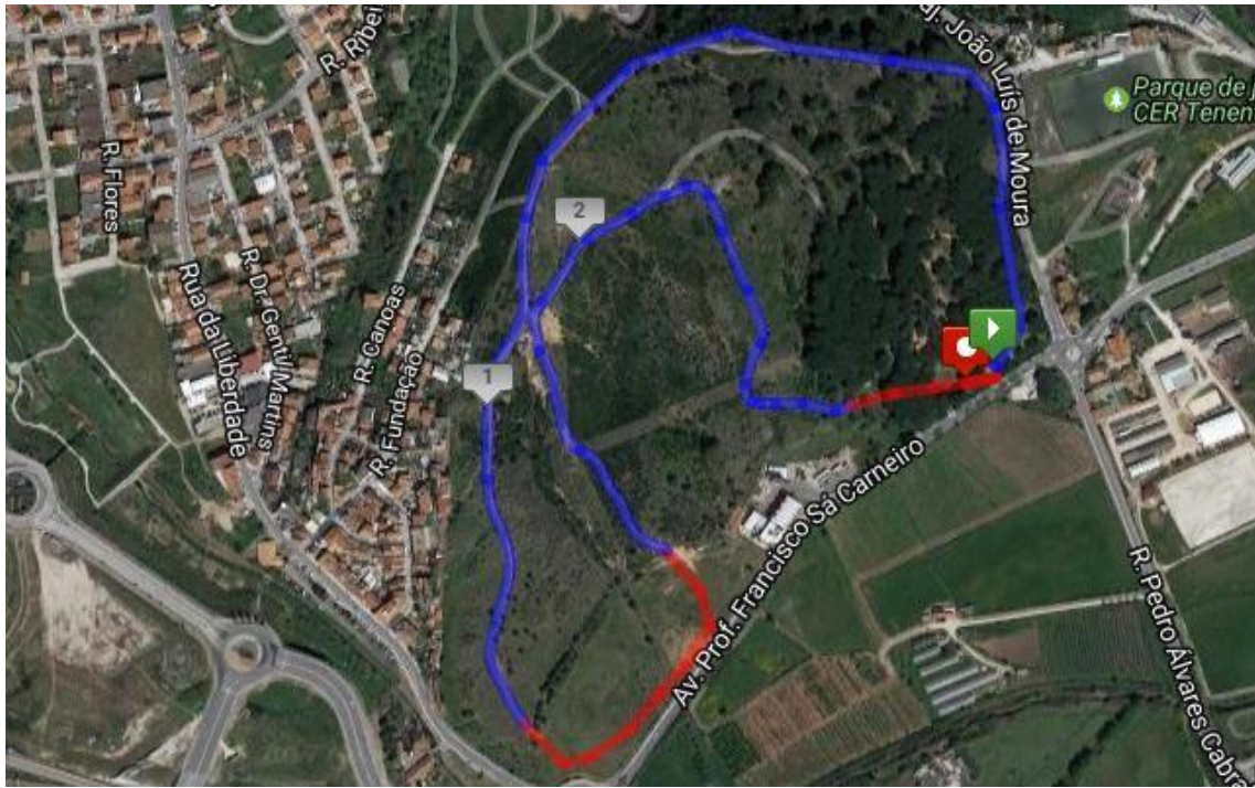
Légua Noturna de Odivelas: Corrida de estrada com uma distância de 5km